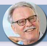
Bruno S. Frey Research Director at Center for Research in Economics, Management & Arts, Zürich